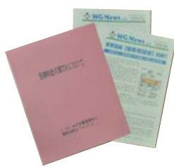
『警備料金適正化に向けて』 (ワーキンググループ冊子発行)