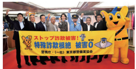
犯罪抑止キャンペーンで防犯グッズを配布

身近な犯罪に対する注意喚起を図るチラシ、パンフレット、防犯グッズ等を作成して配布する等犯罪抑止活動に貢献しております。