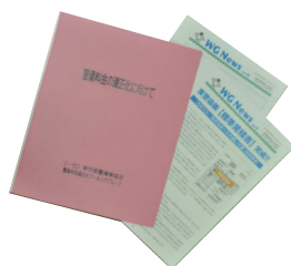
『警備料金適正化に向けて』 (ワーキンググループ冊子発行)