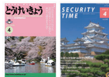
毎月発行機関誌 「とうけいきょう」 & 「SECURITY TIME」