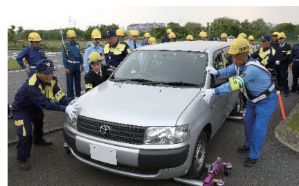
警視庁と合同で行う指導者訓練

公的機関だけでは対処できないと判断される首都圏を襲う大規模地震が発生したときに備え、警備員による災害支援体制の確立を目指し、環境構築、指導者訓練、研修会及び地域ごとの招集訓練等を行っています。