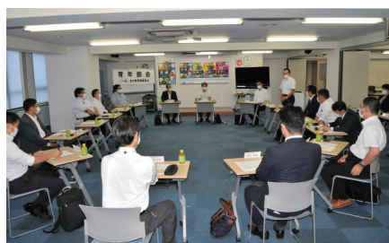
各委員会・部会で課題を検討

警備業の抱える諸問題に対して、研修会を開催するなど対策を検討し、環境向上を図っています。