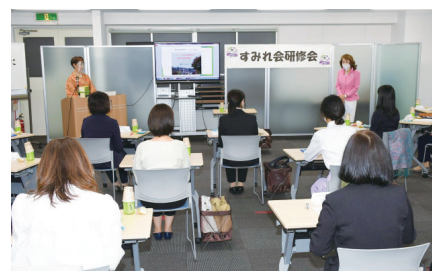
女性限定で研修会を実施