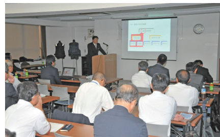
警備業務ごとの研修会

「犯罪に強い社会」を構築するため、関係機関等との連携を密にし、情報の収集及び調査研究を行うとともに、警備業務の適正な運営に寄与しています。